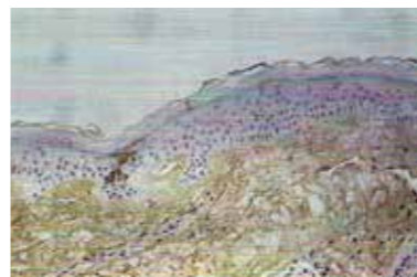
600x forstørrelse: Biopsi av hodebunnen til samme pasient etter behandling med NISIM Shampoo og Extract viser minskede nivåer av DHT.

*Dihydrotestosteron (DHT) er ifølge nyere forskning hovedårsaken til genetisk hårtap. Personer med alopecia androgenetica har forhøyede nivåer av DHT i områder av hodebunnen med hårtap. DHT bidrar til en forkortet vekstfase, miniaturisering av hårfolliklene og færre antall synlige hår. Kilder: National Health Service (NHS), UK, Wikipedia, HHS (Department of Health and Human Services USA), NIH (National Institutes of Health, USA).